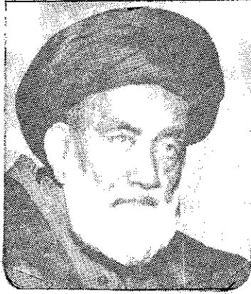
علامہ سید علی نقی نقوی مجتہد اعلیٰ اللہ مقامہ