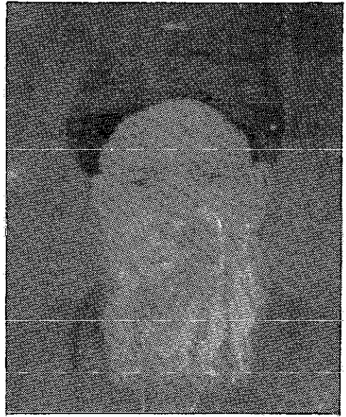
مولانا سید منظور حسین نقوی پیش نماز جامع مسجد علی پور