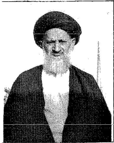
علامہ سید محمد جعفر قبلہ شہید