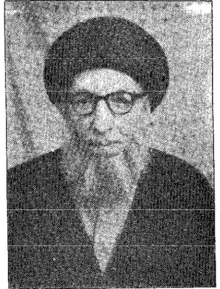
تمثال مبارک حضرت آیت اللہ العظمیٰ جناب آقائے حاج سید محمد رضا گلپایگانی دامت برکاتہ